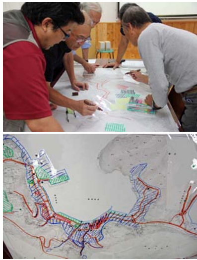
色塗りされた菱浦区の地図

第二部で行ったDIGとは、 ● Disaster 災害 ● Imagination 想像力 ● Game Ⅱゲーム の頭文字を取って名付けられた図上訓練、災害シミュレーションゲームです。また「DIG」は英語で「掘る、探求する」という意味があることから、「防災意識を掘り起こす」「まちを探求する」という意味も込められています。